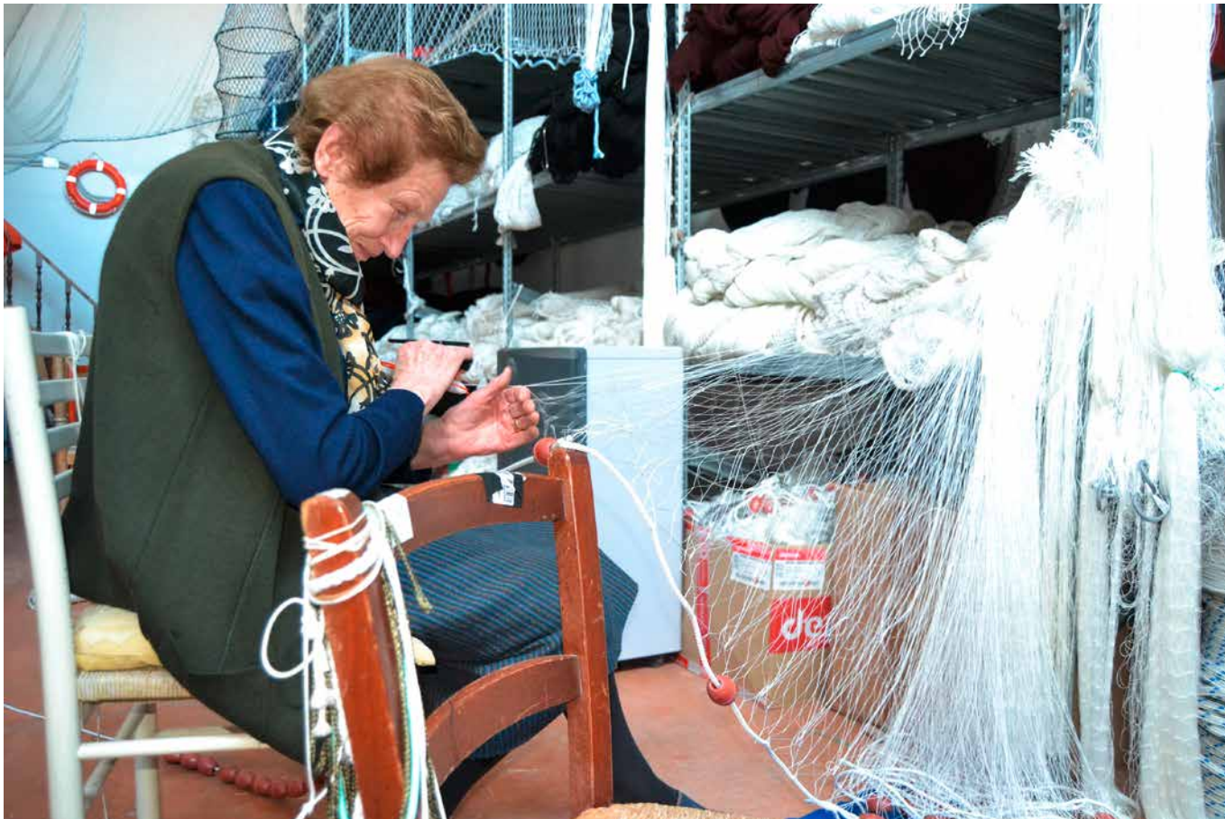
Fotografie de Cinzia Gozzo (FLAG Venețian) în cinstea Zilei Internaționale a Femeii din 2017